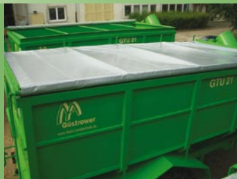
Rolós ponyva (szériatartozék)